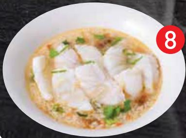
8 Soft boiled rice w/ Fish ข้าวต้มปลา $18