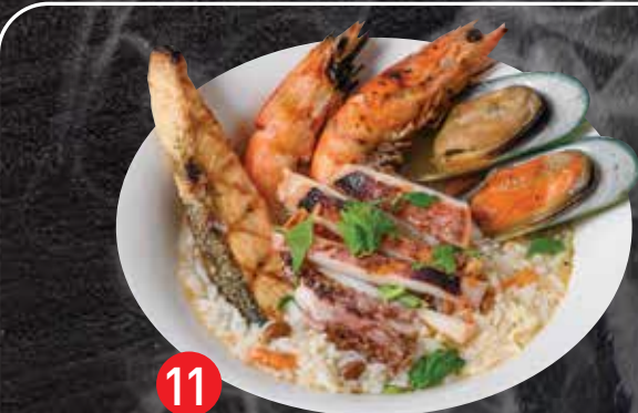
11 Soft boiled rice w/ Grilled Mixed Seafood ข้าวต้ม 4 Kings Jumbo $24.5