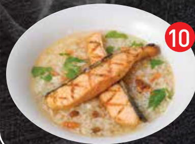
10 Soft boiled rice w/ Grilled Salmon ข้าวต้มแซ่บมอลอย่าง $20.5