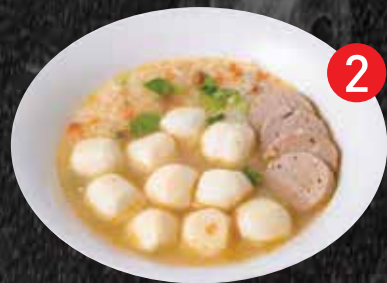
2 Soft boiled rice w/ Fish Balls ข้าวต้มเฝ็ม 16 $16