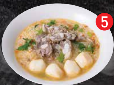
5 Soft boiled rice w/ Pork Ribs ข้าวต้มกระดูกหมู $16