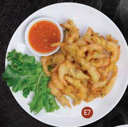
E7. GOONG PAIR กุ้งปว $12.90 Deep fried school prawns coated with Thai batter served with sweet chilli sauce