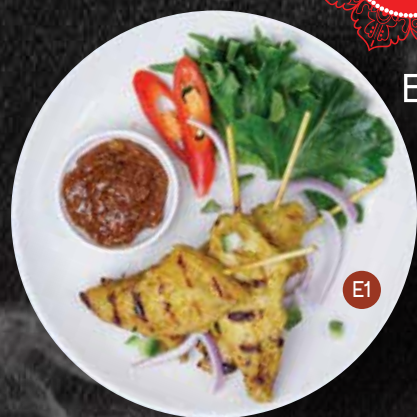
E1. SATAY CHICKEN สะตือไก่ 4 skewers $12.90 Skewered chicken marinated with curry powder served with peanut sauce.