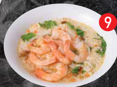
9 Soft boiled rice w/ Prawns ข้าวต้มกุ้ง $16