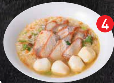
4 Soft boiled rice w/ BBQ Pork ข้าวต้มหมูแดง $16