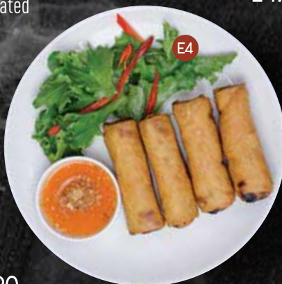
E4. DEEP FRIED VEGETABLE SPRING ROLL ปอเปี๊ยะผักทอด $11.90 Spring roll pastry wrapped with glass noodle, cabbage, carrot, fried tofu, deep fried served with sweet & sour sauce & peanut.