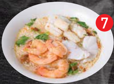
7 Soft boiled rice w/ Mixed Seafood ข้าวต้มทะเล $18