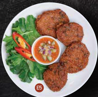
E5. FISH CAKE 4pcs ทอดมัน $10.90 Deep fried minced fish blended with red chilli paste, Thai herbs, served with sweet chilli sauce, cucumber, red onion and peanut.