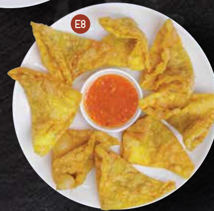
E8. DEEP FRIED WONTON เกี๊ยวกรอบทรงเครื่อง 8pcs $12.90 Wonton skin wrapped with marinated pork minced served with sweet chilli sauce.