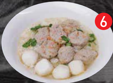
6 Soft boiled rice w/ Rugby ข้าวต้มรักบี้ $16