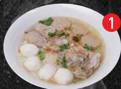
1 Soft boiled rice w/ Combination Pork ข้าวต้มสุยทะเล $16

*Our soup is pork base contain dried shrimp & bean paste