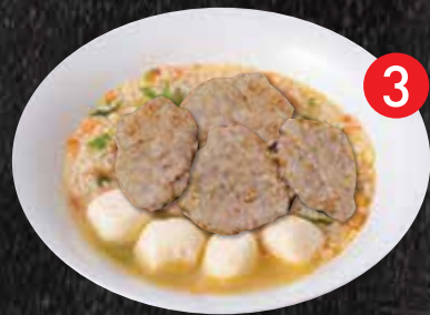
3 Soft boiled rice w/ UFO ข้าวต้ม UFO $16