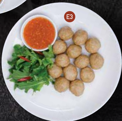
E3. LOOK SHIN MOO TOD 12 pcs ลูกชิ้นหมูทอด $7.90 Deep fried pork balls served with sweet chilli sauce.