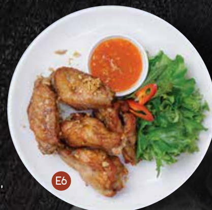
E6. CHICKEN WINGS 5pcs ปีกไก่ทอด $10.90 Dodee's special marinated chicken wings. Coated with Thai batter then deep fried. Served with sweet chilli sauce.